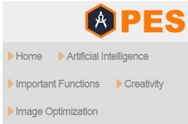
Photo Editing Software